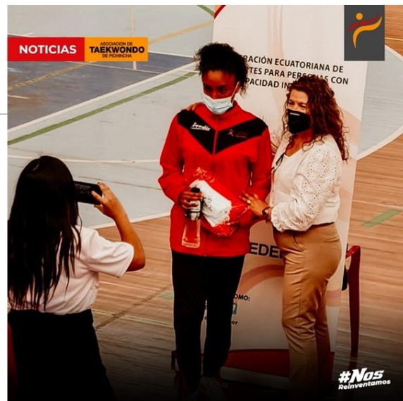
Gráfico No. 8

Deportistas de para Taekwondo fueron convocados por la federación ecuatoriana de deportes para personas con discapacidad intelectual (FEDEDI) con el fin de entregar varios kits deportivos. 14 de abril de 2022