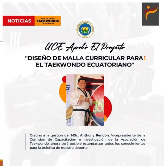
Gráfico No. 6

CURSO INSTRUMENTOS DIDÁCTICOS PARA APLICAR EN LAS CLASES DE TAEKWONDO 8 DE ABRIL DE 2022