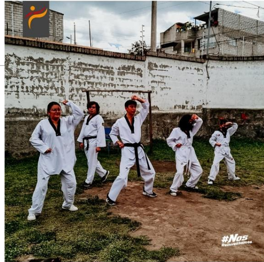
Gráfico No. 21

Realizamos una exhibición, entrega de refrigerios y más ayudas a la fundación ECUSOL. 30 de mayo de 2022