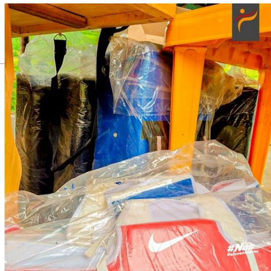
Gráfico No. 31

La asociación de taekwondo de pichincha presente en la ceremonia de ascenso de cinturón y entrega de implementos deportivos en el cantón Pedro Vicente Maldonado 16 de julio del 2022