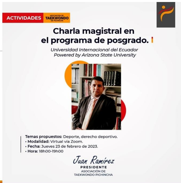
Gráfico No. 9

Gracias a la universidad internacional del ecuador, estaremos presentes como ponentes en la charla magistral sobre derecho deportivo. 12 de abril de 2022