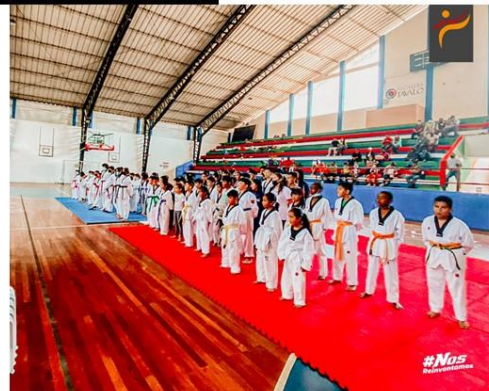
Gráfico No. 18

Intercambio deportivo de preparación categoría infantil de pichincha. Realizado en la liga deportiva cantonal Otavalo. 22 de mayo del 2022