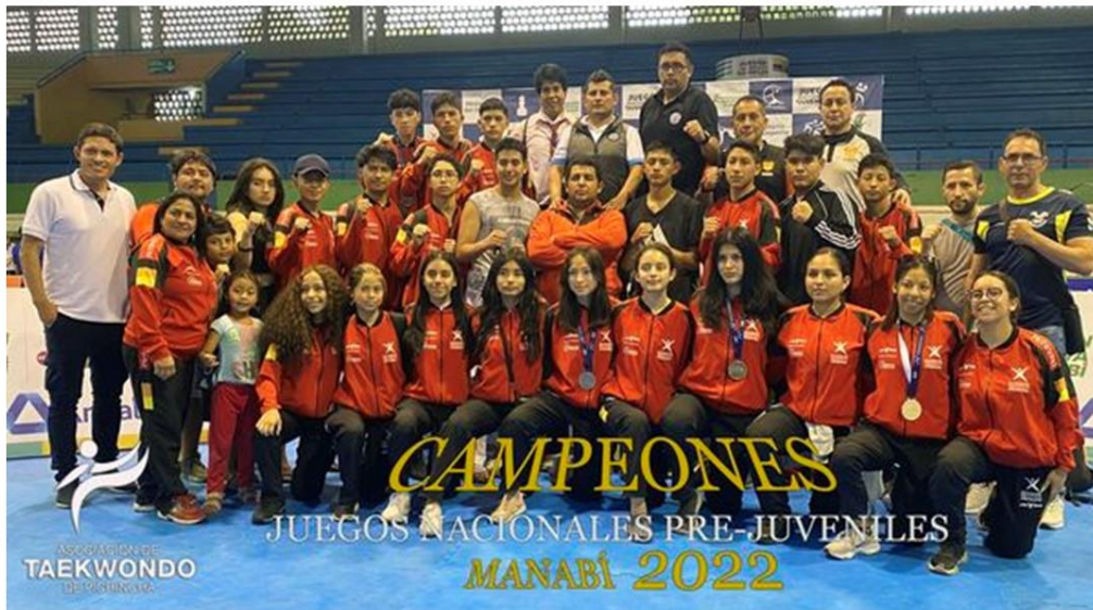
Gráfico No. 33

Pichincha campeón en la VIII copa embajador de Korea. 30 de julio del 2022