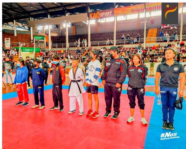
Gráfico No. 24

Extendemos un saludo y reconocimiento a nuestros deportistas que viajarán al campeonato panamericano. 8 de junio de 2022