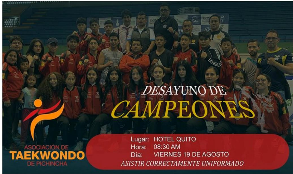
Gráfico No. 36

Como muestra de afecto la asociación de taekwondo de pichincha brindo un desayuno a todos nuestros deportistas y entrenadores. Ganadores de los juegos nacionales Manabí 2022. 17 de agosto del 2022