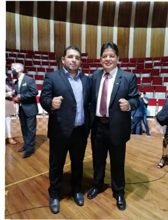
Gráfico No. 1

Posesion del directorio. 8 de marzo del 2022