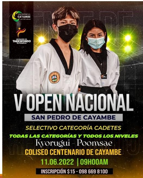
Gráfico No. 23

La asociación de taekwondo de pichincha junto a liga deportiva cantonal Cayambe realizaron el V open nacional san pedro de Cayambe, con motivo de sus fiestas patronales. 11 de junio de 2022