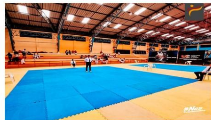
Gráfico No. 28

Realizamos una gira de preparación en las provincias de El Oro y Azuay con el equipo a participar en juegos nacionales. 12 de junio del 2022