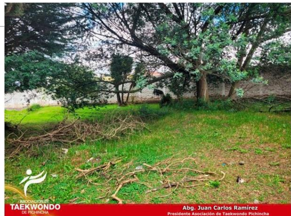
Gráfico No. 41

El día lunes 05 de septiembre del 2022 se iniciaron oficialmente los trabajos para la reconstrucción del nuevo coliseo de taekwondo en la liga cantonal de mejía.