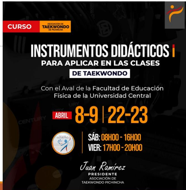
Gráfico No. 5

CURSO INSTRUMENTOS DIDÁCTICOS PARA APLICAR EN LAS CLASES DE TAEKWONDO 8 DE ABRIL DE 2022