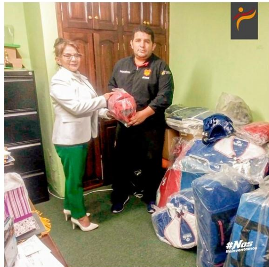
Gráfico No. 30

La asociación de taekwondo de pichincha realizó la entrega de implementos a liga deportiva cantonal de Mejía. 16 de julio del 2022