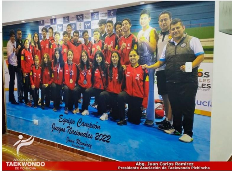
Gráfico No. 38

Instalamos un mural en honor al reconocimiento a la labor de nuestros campeones de los juegos nacionales 2022, ubicado en el polideportivo de la asociación de taekwondo de pichincha. 23 de agosto del 2022