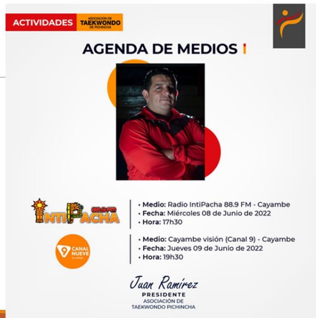
Gráfico No. 26

Toma de fotografía en reconocimiento de estar junto a quienes forjaron el camino para hacer grande al deporte que amamos, quienes le han dado las mayores satisfacciones a nuestra institución. 8 de junio de 2022.