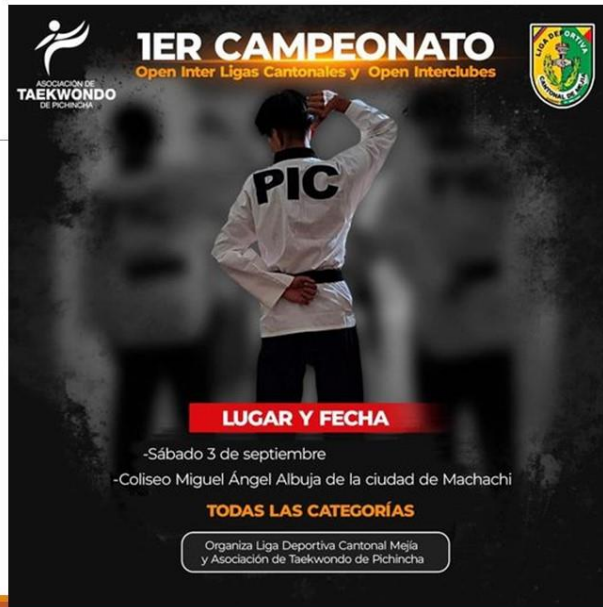
Gráfico No. 40

Open inter ligas cantonales y open inter clubes. Organizado por la asociación de taekwondo de pichincha y la liga cantonal Mejía. 3 de septiembre del 2022