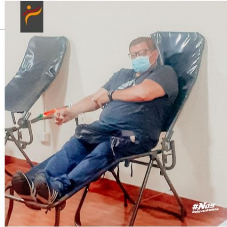
Gráfico No. 17

Todo un éxito la campaña de donación de sangre realizada con el apoyo de la asociación de taekwondo de pichincha. 18 de mayo de 2022