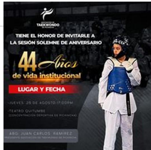
Gráfico No. 39

Jueves 25 de agosto celebramos los 44 años de vida institucional de taekwondo en pichincha.