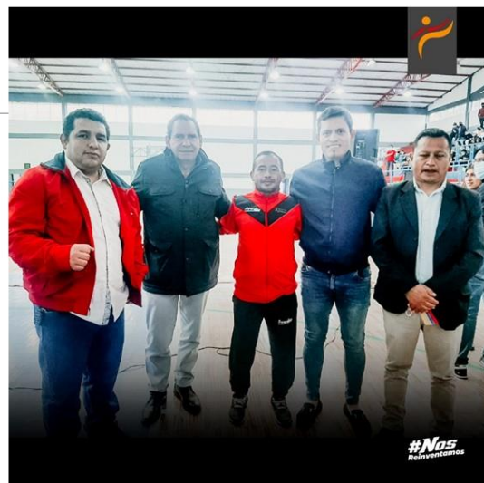
Gráfico No. 10

Acto de inauguración de la remodelación del coliseo de Tabacundo en el cantón Pedro Moncayo. 24 de abril de 2022