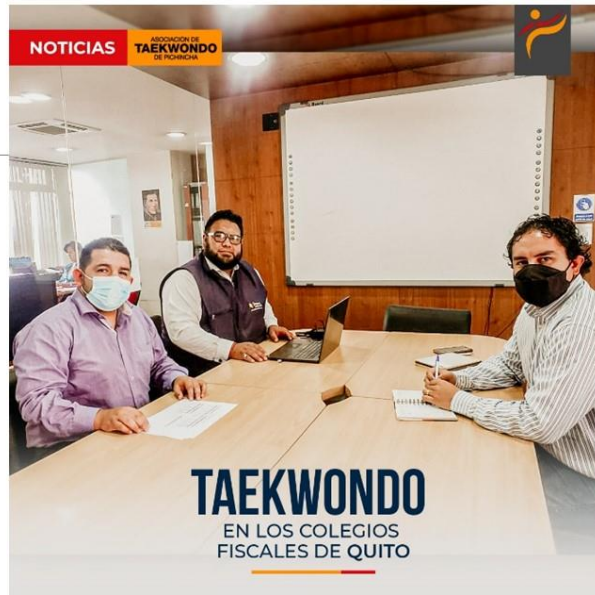
Gráfico No. 14

Elección de comisiones, estamos seguros con este equipo de grandes personas y profesionales, seguimos fortaleciendo la practica del deporte que amamos. 30 de abril 2022