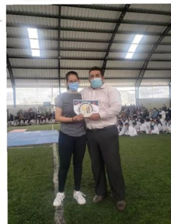
Gráfico No. 2

ENTREGA DE CINTURONES EN EL CANTÓN CAYAMBE 12 DE MARZO DEL 2022