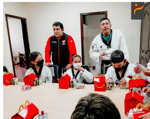
Gráfico No. 22

Disfrutamos de un día maravilloso y homenajeamos a nuestros bajitos, esos seres llenos de alegría y mucha energía que alegran nuestras vidas. 2 de junio de 2022