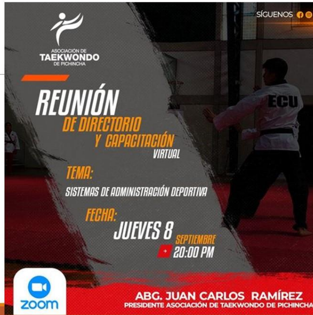
Gráfico No. 42

EL DIA JUEVES 08 DE SEPTIEMBRE DEL 2022 SE LLEVO A CABO LA REUNIÓN DEL DIRECTORIO Y CAPACITACIÓN VIRTUAL.