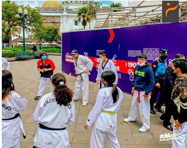
Gráfico No. 19

Presentes con el club Seúl en representación de la asociación de taekwondo de pichincha en la plaza grande - quito, por la celebración del 24 de mayo.