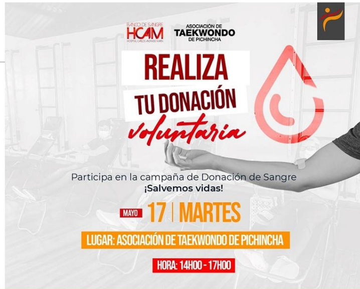
Gráfico No. 15

Campaña de donación “donar sangre salva vidas”. 17 de mayo de 2022