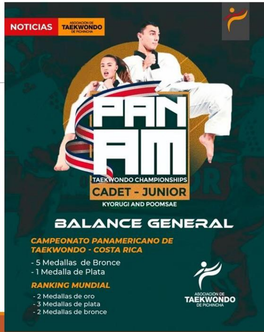
Gráfico No. 29

Destacada participación de nuestros deportistas de la provincia de pichincha en el campeonato panamericano y en el ranking mundial g2. 4 de julio del 2022