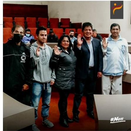
Gráfico No. 13

Elección de comisiones, estamos seguros con este equipo de grandes personas y profesionales, seguimos fortaleciendo la practica del deporte que amamos. 30 de abril 2022