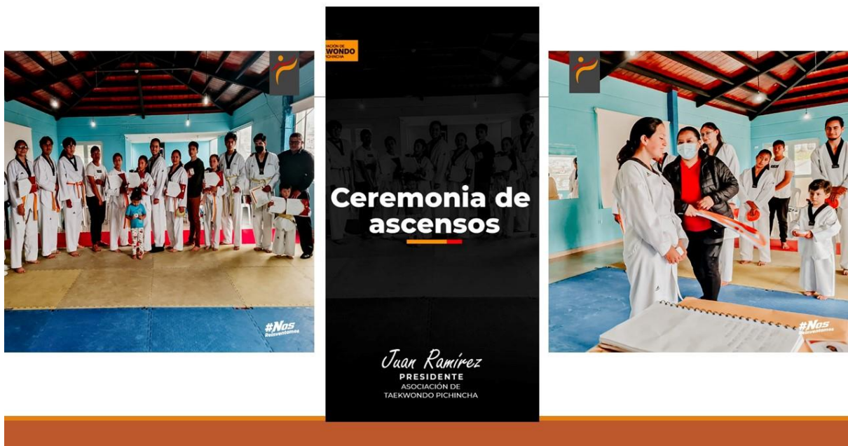
Gráfico No. 16

Campaña de donación “donar sangre salva vidas”. 17 de mayo de 2022