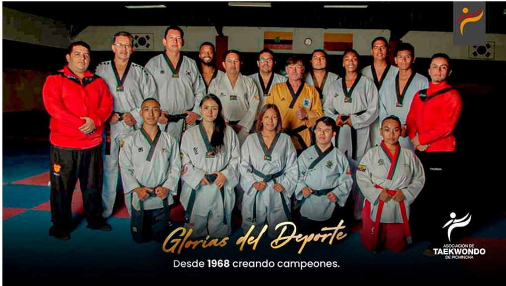
Gráfico No. 25

Toma de fotografía en reconocimiento de estar junto a quienes forjaron el camino para hacer grande al deporte que amamos, quienes le han dado las mayores satisfacciones a nuestra institución. 8 de junio de 2022.