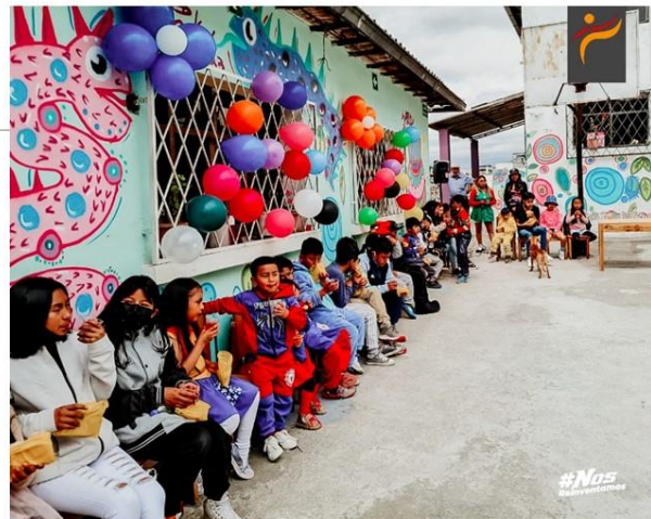
Gráfico No. 20

CONJUNTAMENTE CON EL CLUB SEÚL REALIZAMOS ESTE DÍA LA EXHIBICIÓN, ENTREGA DE REFRIGERIOS Y AYUDAS A MÁS DE SESENTA NIÑOS DEL CENTRO SOCIAL DE TOCTIUCO. 28 DE MAYO DE 2022.