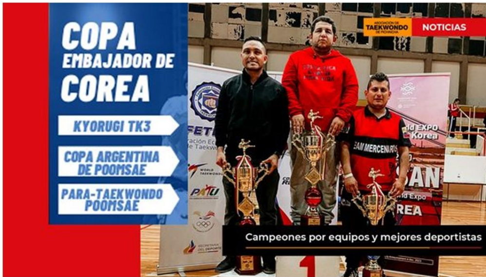
Gráfico No. 32

Pichincha campeón en la VIII copa embajador de Korea. 30 de julio del 2022