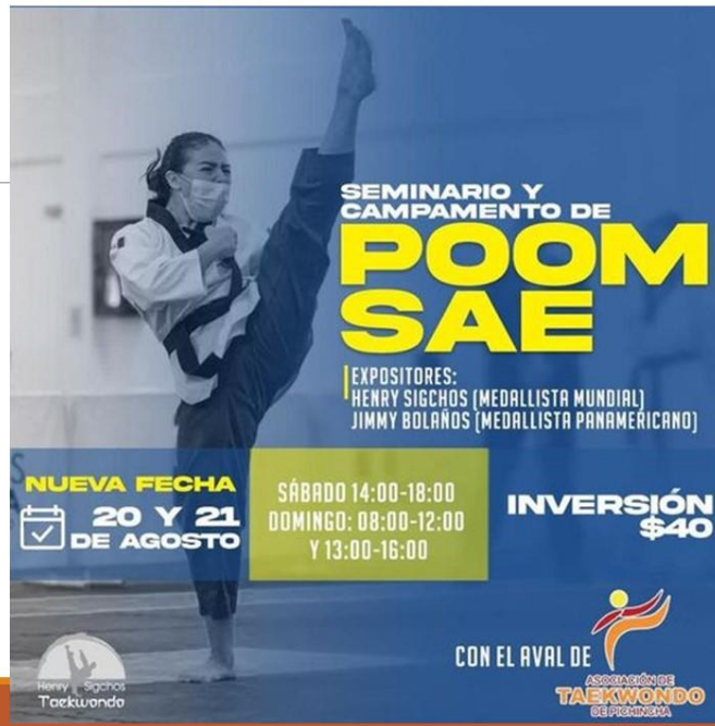
Gráfico No. 34

Campeones juegos nacionales prejuveniles, Manabí 2022. 09 de agosto del 2022